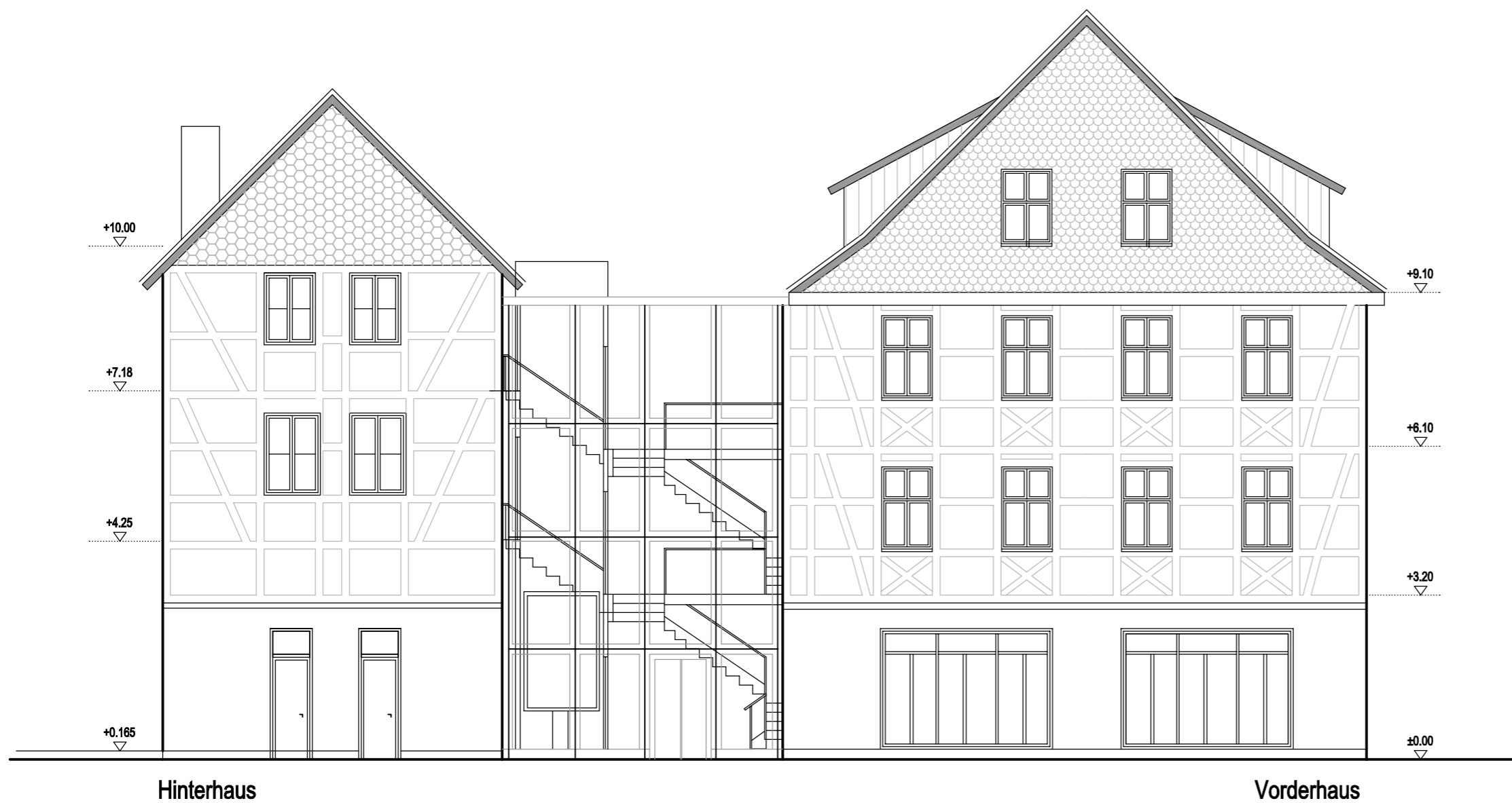
NORDOST - ANSICHT