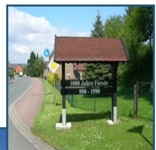
Blick auf Förste

1. Bauabschnitt verkauft 2. Bauabschnitt 5 Bauplätze Kunstbucht